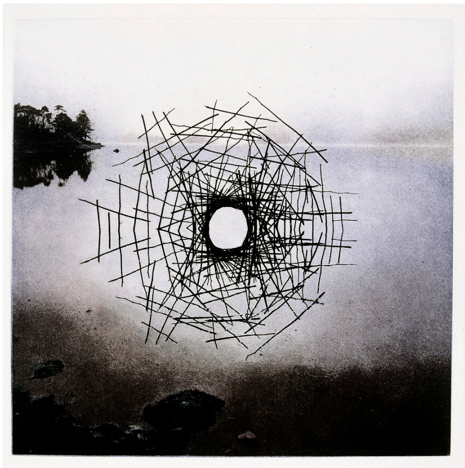
Collection Frac-Artothèque du Limousin - Andy Goldsworthy - N° 1527 - Screen - Report photo et aquatinte 1998